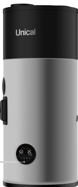
HP 100P pensile