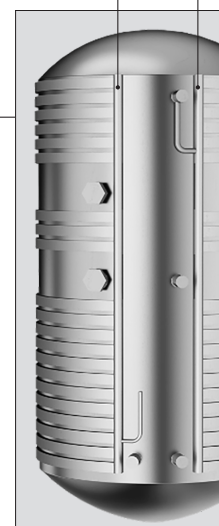
HP 200P -300P a basamento

CONDENSATORE A FLUSSO PARALLELO AD ALTA SUPERFICIE DI SCAMBIO